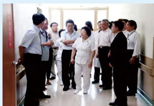
金擘獎委員實地訪查